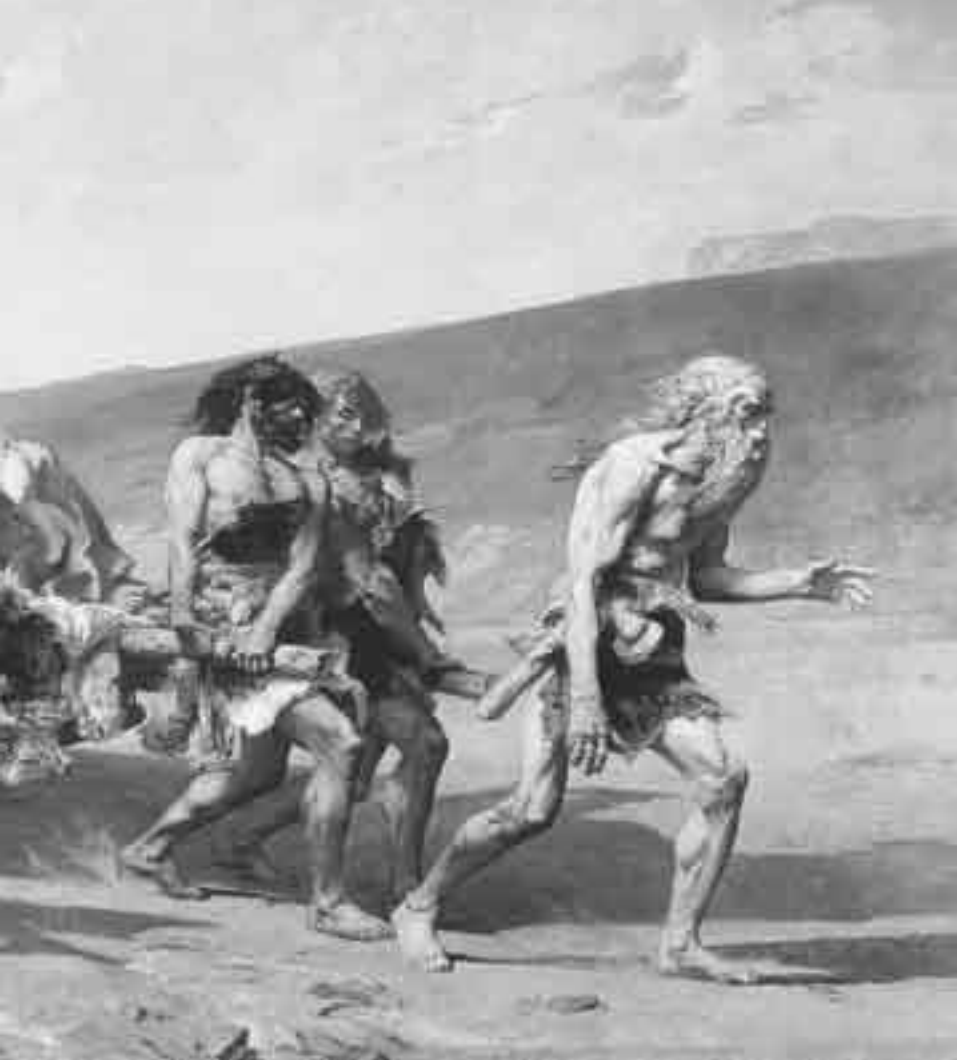
Fernand-Arne Piestre, genannt Cormon: Kain (1880)

des Krieges zur Folge zu haben, die auch die Einsicht in die Möglichkeiten der Zähmung zersetzt. Als am 29. März 1971 ein amerikanisches Militärgericht den Leutnant William Calley wegen vorsätzlichen Mordes an mindestens 22 Zivilisten in My Lai während des Vietnamkrieges zu lebenslanger Zwangsarbeit verurteilte, kam es in der Bevölkerung zu einem Sturm der Entrüstung. Eine neuere Untersuchung von etwa tausend Briefen, die damals an das US-Verteidigungsministerium gingen, ergab, daß mehr als achtzig Prozent der Absender – darunter viele Kriegsteilnehmer und Veteranen – ihr Unverständnis für die Entscheidung äußerten und die Meinung vertraten, daß es auf dem Schlachtfeld keine Regeln gebe, der Soldat außerhalb der Rechtsordnung stehe und insofern auch nicht für Verbrechen belangt werden könne.