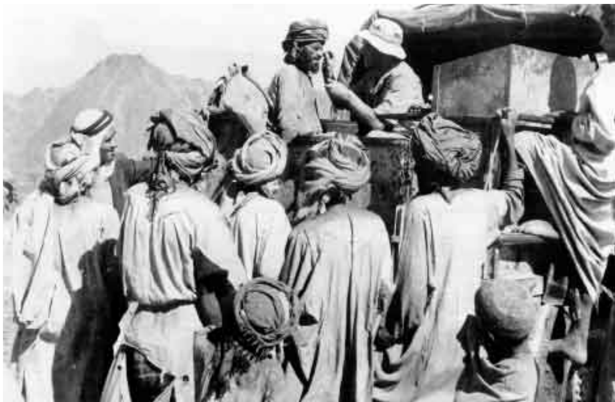
Ein Arzt des britischen Special Air Service (SAS) versorgt Zivilisten im Oman (1972): eine der Maßnahmen, die den örtlichen Partisanen den Rückhalt entzogen

US Field Manual 90-8, Counter Guerilla Operations, US Armed Forces 1986