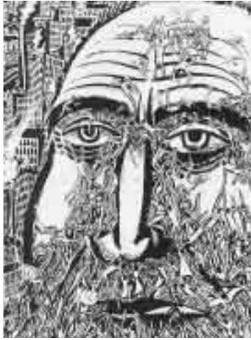
Frans Masareels Antwort: „La Tête géante“ (1921)

Er sieht – trotz des in den letzten Jahrzehnten größer gewordenen Anteils von Managern, Technikern und Spezialisten aller Art in den Verbänden – eine Armee insgesamt mit der Erwartung des Kampfes belastet, die sich auch auf die Funktionen erstreckt, die nicht unmittelbar zu den Kampfhandlungen gehören. Nicht das Erzielen eines Profits steht im Mittelpunkt der soldatischen Tätigkeit, und Kosten-Nutzen-Kalküle sind auf das innere Selbstverständnis einer Armee nicht übertragbar, denn „... keine Art von Nützlichkeitsdenken in der Welt (kann) im einzelnen Menschen die Bereitschaft wecken ..., sein Leben hinzugeben.“