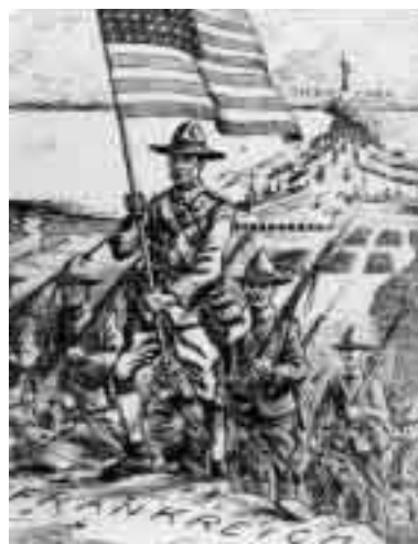
Mit dem Ballon über den deutschen Stellungen abgeworfenes amerikanisches Flugblatt, 1917

Trotz aller Vorbereitung auf die Bedrohungen der Zukunft und eines wirklich erkennbaren Willens, gerüstet zu sein, lassen sich Schwachstellen in der Politik der USA und in ihrer inneren Entwicklung ausmachen. Ein erhebliches Problem ist der utopische Glauben an ein universales Wertesystem, demzufolge in jedem Menschen ein Amerikaner stecke, der „raus“ möchte. Diese Überheblichkeit wird von nicht wenigen Kritikern als der eigentliche Grund für einen rabiaten Antiamerikanismus angesehen. Die zweite Schwachstelle ist die Fehleinschätzung, daß multiethnische Staaten wie Bosnien oder Afghanistan durch Sozialingenieure und den Vorgang eines künstlichen nation building zusammengehalten werden könnten, wobei der Zauberstab „Demokratisierung“ heißt. Drittens – mit Blickwendung ins Land selbst – bedroht die ethnische Veränderung der US-Bevölkerung die innere Konsensfähigkeit, weil neue Zuwanderungswellen im Gegensatz zu ihren europäischen Vorgängern den Wertekonsens kündigen und sogenannte ethnische Brückenköpfe bilden könnten. Diese drei Faktoren führen zu einer nachhaltigen Erosion der kollektiven Energie und stellen die USA schon innerhalb der nächsten Jahrzehnte vor existentielle Schwierigkeiten, deren Umfang heute noch nicht abzusehen ist.