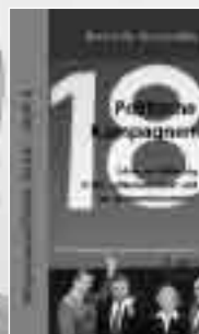
Heft 4: Politische Kampagnen 40 Seiten, September 2002