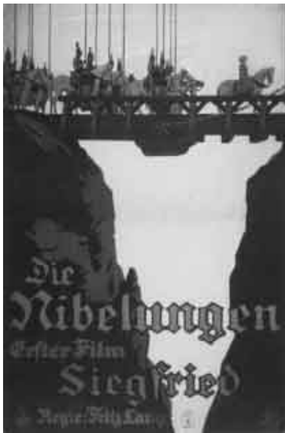
Filmplakat zur Erstaufführung

Die Nibelungen machten Lang zu einem der wichtigsten deutschen Regisseure. Auch seine folgenden Arbeiten wie etwa der berühmte Film Metropolis waren große Erfolge. Die Karriere schien allerdings mit der nationalsozialistischen Machtübernahme beendet. Einige der jüngeren Produktionen Langs – Die Frau im Mond und M – Mörder unter uns – wurden verboten. Dagegen schätzte Hitler Die Nibelungen sehr und unterstützte die Herstellung einer vertonten Fassung des ersten Teils; die Aufführung von Kriemhilds Rache blieb bezeichnender Weise untersagt. Lang selbst, der jetzt als „Halbjude“ galt, verließ Deutschland bereits 1933. Wie glaubwürdig seine Behauptung ist, Goebbels habe ihm die Stelle eines Reichsfilmintendanten angeboten, bleibt dahingestellt. Lang emigrierte zuerst nach Frankreich, dann in die USA, um in Hollywood seine Arbeit fortzusetzen. Obwohl auch später in seinen Filmen – bis hin zu Der Tiger von Eschnapur – großartige Kulissen und Massenszenen eine Rolle spielten, hat er alles getan, um die Erinnerung an den Nibelungen -Film vergessen zu machen oder doch dem Vorwurf zu begegnen, es habe sich um eine Frühform von „Naziästhetik“ gehandelt; in einem wenige Jahre vor seinem Tod 1976 geschriebenen Brief stellte Lang allen Ernstes die Behauptung auf, es sei ihm darum gegangen, den