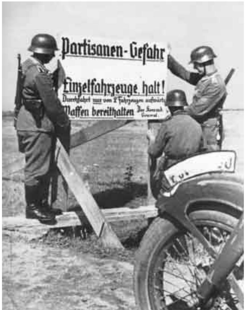
Wachsende Gefahr durch Partisanen zwingt zu Vorsichtsmaßnahmen: Sowietunion 1943

Aber auch noch so realistische Trainingsszenarien reduzieren die hohen Risiken des Häuserkampfes kaum. An die Gefahren und potentiellen Verlusten, die mit einer kampfmäßigen Eroberung Bagdads verbunden wären, möchte heute sicher noch kein alliierter Truppenführer denken.