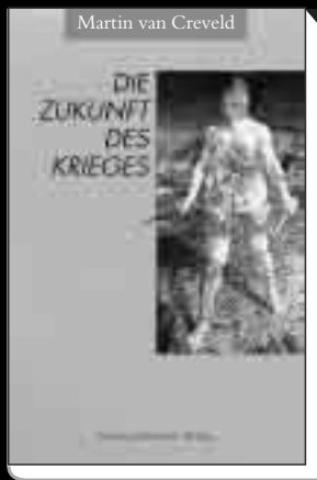
Martin van Creveld Die Zukunft des Krieges 352 Seiten / € 29,60 / sFr. 49,70 ISBN 3-932425-04-9

Woodward umkreist zu Beginn noch einmal den Schockzustand, den der 11. September 2001 in den USA auslöste. Auf einen Angriff, wie er sich an diesem Tag vollzog, waren, das macht Woodward deutlich, die Vereinigten Staaten in keiner Weise vorbereitet. Die Bush-Regierung kam relativ schnell zu dem Ergebnis, daß die Drahtzieher aufgespürt und gegebenenfalls getötet werden müßten: „Wir müssen al-Qaida den Unterschlupf nehmen, sagte Tenet. Den Taliban sagen, daß wir mit ihnen fertig sind ... Rumsfeld sagte, sie sollten jedes Machtmittel benutzen, nicht nur