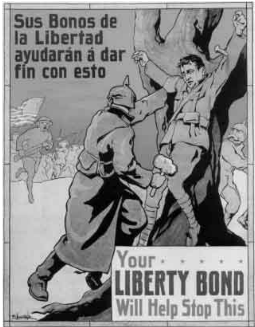
Folgen des diskriminierenden Feindbegriffes: antideutsches Plakat USA/Manila, 1918

amerikanische Botschaften und Einrichtungen in Afrika oder am Golf. Der Plan für die Terrorangriffe gegen die USA wurde in den Bergen Afghanistans und im europäischen Hinterland erdacht und dann auf einem anderen Kontinent exekutiert. Das Flugzeug, das Transportmittel der Globalisierung par excellence, setzte man als Waffe ein. Planung und Operation der Terroraktion hatten globale Maßstäbe. Weltweit operierende warlords wie Osama Bin Laden könnten bevorzugte Akteure dieser neuen Form des bewaffneten Kampfs werden.