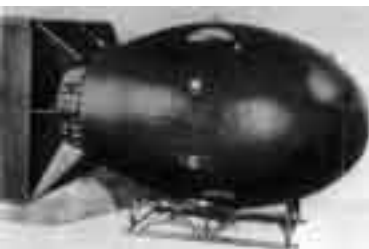
oben: Little Boy – die Atombombe, die Hiroshima vernichtete