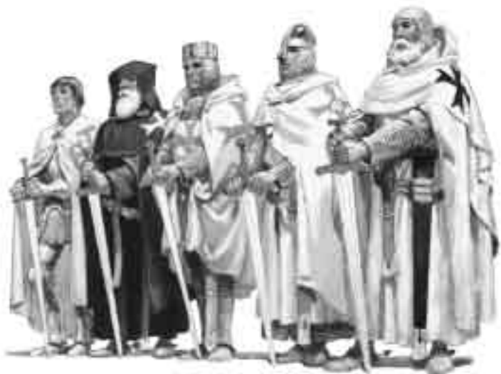
Ordensritter, Zeichnung von Pierre Joubert

Man kann Auffarths Interpretation der Kreuzzugsidee nicht aus dem Zusammenhang seiner Gesamtdeutung der Geistesgeschichte lösen, die in den übri-