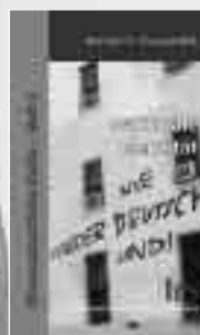
Heft 3: Nationale Identität 32 Seiten, Mai 2002