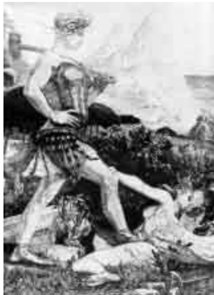
Max Klinger: Zeit und Ruhm

Das Verschwinden konventioneller Kriege und das Aufkommen neuer Konfliktformen (die nicht weniger blutig sind als konventionelle Kriege, seit 1945