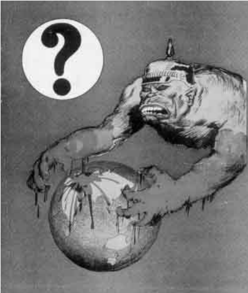
Plakat Australien, 1918

politische Führung bei außenpolitischen Problemen regelmäßig an der Innenpolitik orientiert, Bedrohungen ignoriert oder den Vorgaben anderer anschließt.