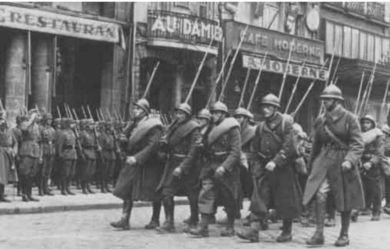
Parade französischer Truppen nach ihrer Kapitulation, die deutschen Sieger erweisen die Ehrenbezeugung, Lille, Juni 1940

Die klassische Analyse für dieses Umschlagen der Argumentation hat Max Weber in seiner berühmten Rede über Politik als Beruf (1919) geliefert. Als Beispiel stand ihm der amerikanische Präsident Woodrow Wilson vor Augen, der nach seiner ursprünglichen Parteinahme für den Pazifismus den Kriegseintritt der USA nur legitimieren konnte mit der Verheißung, dies sei „der Krieg, der alle Kriege beende“ und der die Welt „sicher für die Demokratie“ machen werde, und als zweites Exempel dienten die deutschen Radikalsozialisten, die gestern noch die Verteidigung des Vaterlandes sabotierten und die Inhumanität des Krieges beschworen und heute Krieg und Bürgerkrieg rechtfertigten, aus denen eine neue Welt geboren werde. Weber glaubte, daß der innere Zusammenhang zwischen den so weit auseinander liegenden Positionen begründet sei in der Unfähigkeit, „ethische Irrationalität“ zu ertragen. Absoluter Pazifismus sei aber als politisches Konzept unbrauchbar und nur als religiöses Postulat vorzustellen. Tatsächlich gab und gibt es die Forderung nach völliger Gewaltlosigkeit in verschiedenen Glaubenslehren, vor allem im Christentum und im Buddhismus. Allerdings war