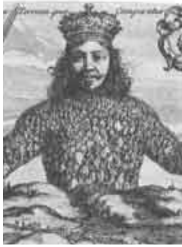
Leviathan von Thomas Hobbes, 1651 (Ausschnitt aus dem Titelblatt der Erstaussgabe)

Verteidigungsministeriums entstanden, um eine Reform der Streitkräfte vorzubereiten, nachdem sich die Armee in den letzten Jahren der Präsidentschaft Carters in einem außerordentlich schlechten Zustand befunden hatte.