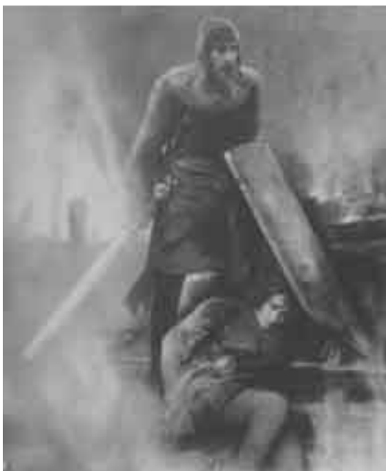
Filmszene: Hagen schützt Gunther in der brennenden Halle Etzels

Die Dreharbeiten für das aufwendige, aus zwei Teilen – Siegfried und Kriemhilds Rache – bestehende Werk hatten fast zwei Jahre in Anspruch genommen. Lang erklärte zwar, nicht mit der Monumentalität des amerikanischen Films in Konkurrenz treten zu wollen, aber Siegfrieds Kampf mit dem Drachen, die Burg Brunhilds inmitten eines Flammenmeers,