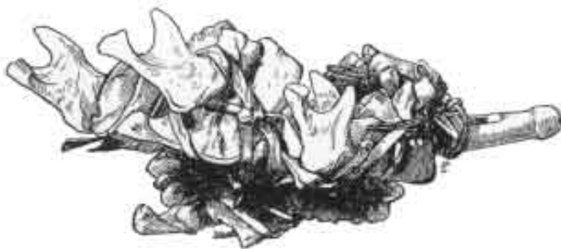
Mit Menschenkiefeln besetzte Elfenbeintrompete aus Togo, um 1900

Es hat gegen diese Art der Argumentation von Anfang an Widerspruch gegeben, die nicht nur auf die Unwahrscheinlichkeit der ursprünglichen Vereinzelnung abhob, sondern auch die Friedfertigkeit des frühen Menschen in Frage stellte. Seit der zweiten Hälfte des 19. Jahrhunderts bezog die skeptische Anthropologie ihre Argumente allerdings nur noch zum Teil aus der religiösen oder philosophischen Tradition. Die Vorstellung, daß das Dasein vom Kampf bestimmt werde, erhielt durch die Lehre Darwins vom struggle for life , der nicht nur die natürliche Selektion, sondern auch die Geschichte des Menschen bestimme, eine ganz neue Plausibilität. Deshalb neigten aber nicht alle Sozialdarwinisten zur Rechtfertigung des Krieges, der offenkundig gerade die tüchtigsten Individuen vernichtete. Allgemein war nur die Anschauung von seiner Unvermeidbarkeit.