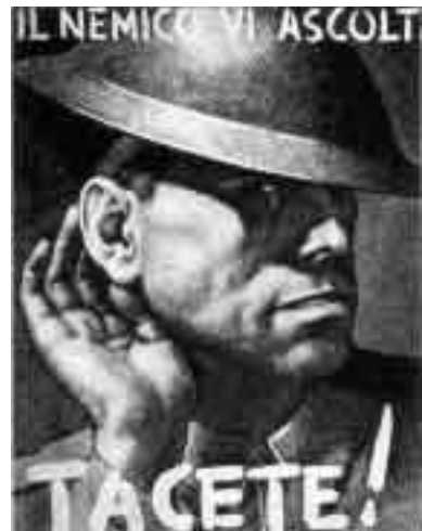
„Feind hört mit“ – Plakat Italien, 1943

Die internationalen Beziehungen und die politische Handlungsfähigkeit von Staaten und Bündnisssystemen hängen zunehmend von technischen Fähigkeiten zur Informationsvermittlung und Systemsteuerung ab. Umgekehrt eröffnen die elektronischen Medien Möglichkeiten des kollektiven Handelns und der internationalen Organisation, die sich der politischen Kontrolle durch den Staat und