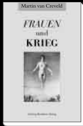
Martin van Creveld Frauen und Krieg 324 Seiten / € 29,60 / sFr. 49,70 ISBN 3-932425-33-2

Der Krieg ist eine Geißel, die die Menschheit seit ihrer Geburt begleitet: eine Geißel selbsterfunden und selbstgemacht. Sich Gedanken über die Zukunft des Krieges zu machen und über die Rolle der Frauen im Krieg, ist sicherlich von herausragender Bedeutung.