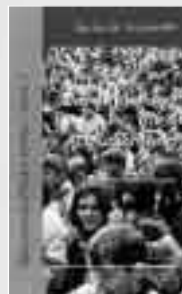
Heft 1: Zuwanderung in Deutschland 30 Seiten, November 2001