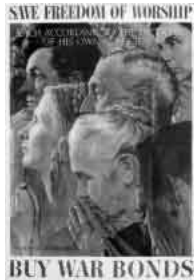
Plakat USA, nach einem Motiv von Norman Rockwell, 1943

Warum führen die Amerikaner Krieg? In erster Linie zur Durchsetzung eigener nationaler Interessen oder derjenigen verbündeter Staaten. Dazu gehörten bis zum Ende des Kalten Krieges, der bipolaren Weltordnung also, auch strategische Ressourcen. Seither hat die Globalisierung der Märkte, also ihre Öffnung über alle politischen Grenzen hinweg, die Bedeutung dieses Aspekts jedoch stark relativiert. Wichtiger ist heute, globale Energiequellen und Kommunikationswege einfach offenzuhalten. Ölkonzerne sind meist multinational organisiert, und so hat die direkte Kontrolle von Ländern, und damit ein zentraler Aspekt geostrategischer Überlegungen, erheblich an Relevanz verloren. Die Ölvorkommen Kanadas sind größer als die des Irak, die Förderregion um das Kaspische Meer boomt. Moderne Technik bietet zudem neue Möglichkeiten und Alternativen. Weder die USA noch Europa hängen daher von irakischen Öllieferungen ab. Umgekehrt gibt es für den Irak keine Alternativen: Er muß sein Öl verkaufen. Worin sollte also