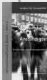
Heft 2: Aufstand der Aufständigen 48 Seiten, November 2001