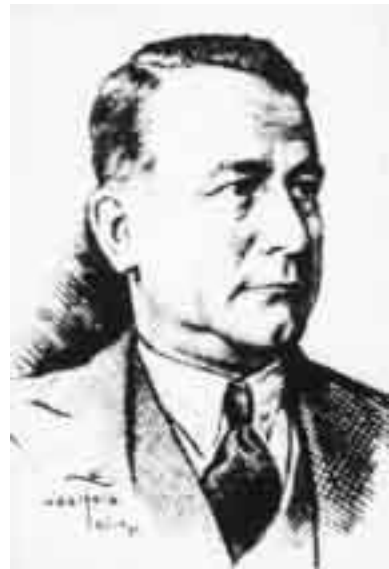
Carl Schmitt, Zeichnung von 1933

Diese Wertschätzung Schmitts erklärt sich vor allem aus dessen epochemachender Lehre vom Politischen, das er im Kern bestimmt sah durch die Unterscheidung von Freund und Feind. Dabei meinte Schmitt „Feind“ im Sinne des lateinischen hostis , das heißt den öffentlichen, den Feind des Staates, nicht inimicus im Sinne von privater Gegner; eine Differenzierung, wie es sie auch im Griechischen mit polemios und echthros gibt. Gegen alle Versuche, die fundamentale Scheidung von Freund und Feind zu umgehen, wie sie vor allem in Deutschland