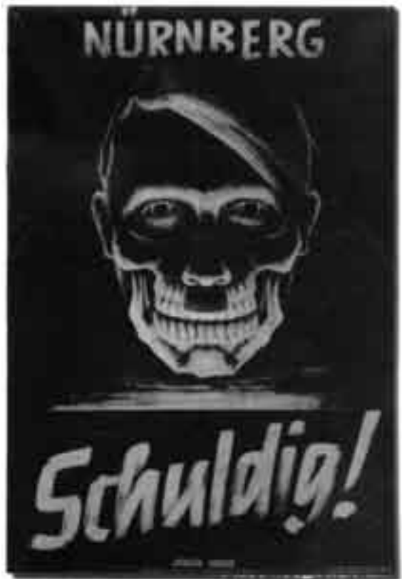
Als der Schuldige noch klar war; Plakat der Sowjetischen Militärverwaltung zu den Nürnberger Prozessen, 1946

Eine von Longerich als Quelle herangezogene Lehrerin aus der Stadt Auschwitz erzählte später, warum sie über ihre Beobachtungen geschwiegen habe: „Ein Weitererzählen hätte damals nur noch mehr Leute unglücklich gemacht, sie in größte Gefahr gebracht. Und hier konnte leider niemand helfen.“ Die Anweisung der BBC-Leitung vom 14. Dezember