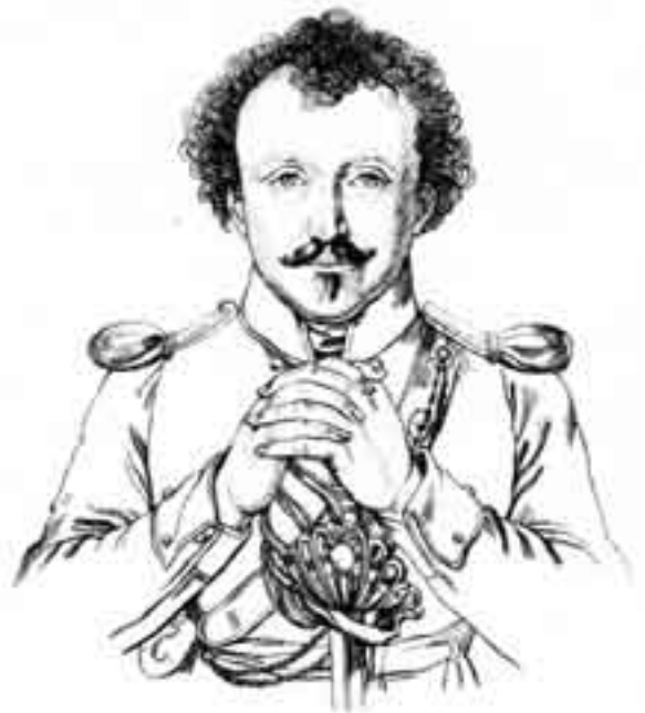
Baron de la Motte Fouqué.

De Bruyn schließt mit Fichtes Reden an die deutsche Nation , die er in ihrer Ambivalenz schildert: Sozialisten und Nationalisten hätten versucht aus Utopien, die Fichte paradigmatisch präsentiert habe, Realität werden zu lassen, „woraus dann hoffentlich das einundzwanzigste Jahrhundert, in dem es nicht mehr die Deutschen sind, die ihre Art zu leben für die wahre und weltbeglückende halten, seine Lehren zieht.“ De Bruyn sieht einen engen Zusammen-