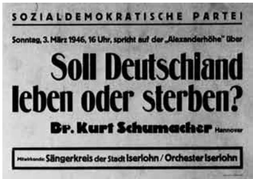
Als das wichtigste Ziel noch klar war; Plakat zu einer Ansprache des „Reichsvorsitzenden“ der SPD, Kurt Schumacher, 1946

1942 zum Herausstellen der Massenmorde an den Juden enthält denn auch den Satz: „Auch wenn die Deutschen nichts gegen die Massaker tun könnten, so sei es doch gut, wenn sie sich beunruhigt und beschämt fühlten.“