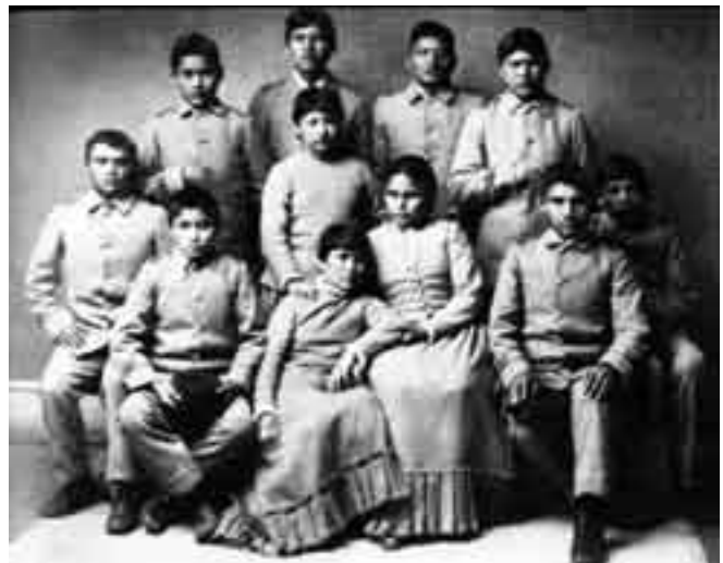
Nach Beginn der Zivilisierung. Gruppe derselben Apachen nach Aufnahme in eine Missionsschule