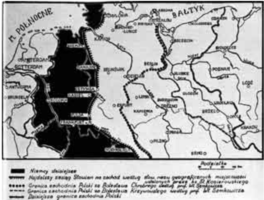
Drang nach Westen. Ende der dreißiger Jahre in Polen verbreitete Propagandakarte mit den angeblichen Grenzen des slawischen beziehungsweise polnischen Siedlungsraums in der Vergangenheit

Henryk Baginski: Poland and the Baltic , Edinburgh 1942 (englische Übersetzung der polnischen Ausgabe von 1927).