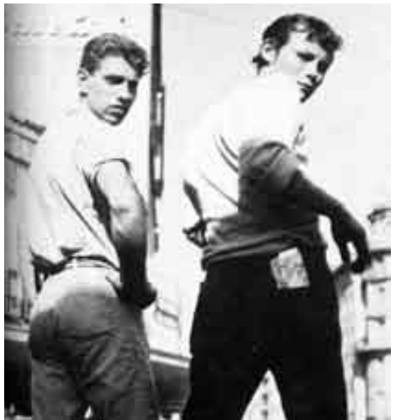
Sind sie zornig?

Schirmmacher ist nicht der erste, der solche Auffassungen vertritt. Die Herrschenden aller Zeiten und Länder haben sich einiges, darunter manches Skurrile einfallen lassen, um den ewigen Störenfrieden der gesellschaftlichen Ordnung Herr zu werden. In Australien forderten die offiziellen Stellen im neunzehnten Jahrhundert Prostituierte aus dem Mutterland an, weil sonst Rebellionen nicht zu verhindern wären. In den USA war der Kult um den Cowboy auch die Legitimierung einer Lebensform, in der sich überschüssige Männer mehr oder weniger ungestraft gegenseitig umbringen konnten. In Kalifornien wurde der Opiumkonsum chinesischer Immigranten toleriert, um die von Testosteron gesteuerte Vitalität der einsamen Einwanderer quasi einzuschläfern. In China, wo das Problem schon damals besonders prekär war, ging man während der Ming-Dynastie dazu über, Zweit- und Drittgeborene zu kastrieren, um das Übel sozusagen an der Wurzel zu packen. Mit dem Ergebnis, daß schließlich über 100.000 Eunuchen Dienst für den chinesischen Kaiser taten. Ein anderer Versuch zur selben Zeit in China sah vor, unverheiratete Söhne zu Mönchen zu