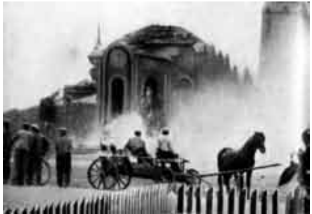
Polnische Nationalitätenpolitik. Zerstörung einer westukrainisch-orthodoxen Kirche in den dreißiger Jahren

Der polnische Nationalismus und seine Affekte sind nicht nur historische Phänomene. Beides wirkt fort bis in die Gegenwart. Das ist am Einfluß der Familie Giertych besonders deutlich zu erkennen. Die Anschauungen des eingangs erwähnten Jędrzej Giertych werden offenbar von dessen Sohn Maciej und dem Enkel Roman zuverlässig weitergeführt. Maciej machte jüngst als Mitglied des Europaparlaments mit der Veröffentlichung einer Broschüre von sich reden, in der er das Judentum aus der europäischen Kulturtradition gestrichen wissen wollte. Roman Giertych hat es nach der Rückkehr von einigen Ausflügen in neo-nationalsozialistische Politikformen zum polnischen Vizepremier gebracht. Es überrascht nicht, wenn in ihrer politischen Arbeit weiterhin hergebrachte Klischees wie das von der unterdrückten polnischen Minderheit in Deutschland und dem Überfallmythos von 1939 transportiert werden. Es finden sich in Deutschland auch reichlich willige Historiker, nicht zuletzt im Deutschen Historischen Institut Warschau, die dies trotz besseren Wissens unkorrigiert lassen. Auch das überrascht kaum.