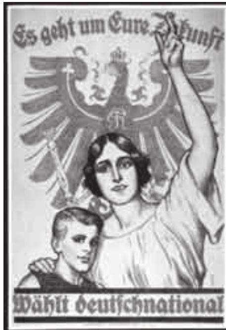
Nicht nur die „drei K“ – Plakat der DNVP aus den zwanziger Jahren