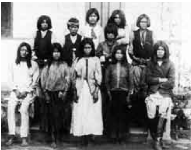
Vor der Zivilisierung. Gruppe von Apachen am Ende des neunzehnten Jahrhunderts